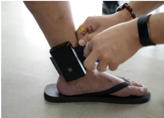
1 ลักษณะการติดตั้งอุปกรณ์ EM ที่ข้อเท้า